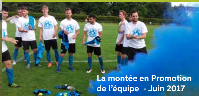
La montée en Promotion de l'équipe - Juin 2017